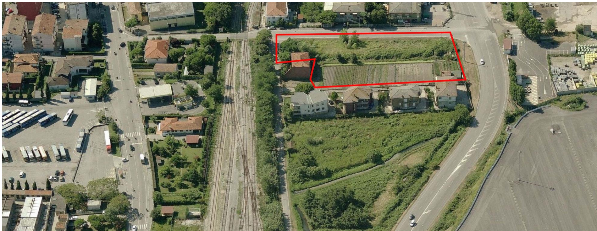
3. Vista aerea da Nord