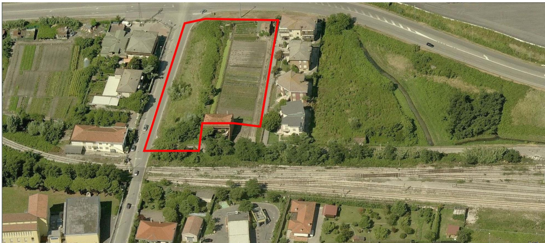
4. Vista aerea da Est