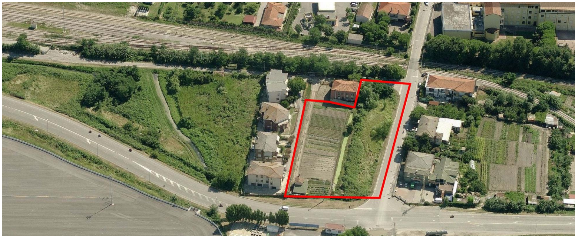
2. Vista aerea da Ovest