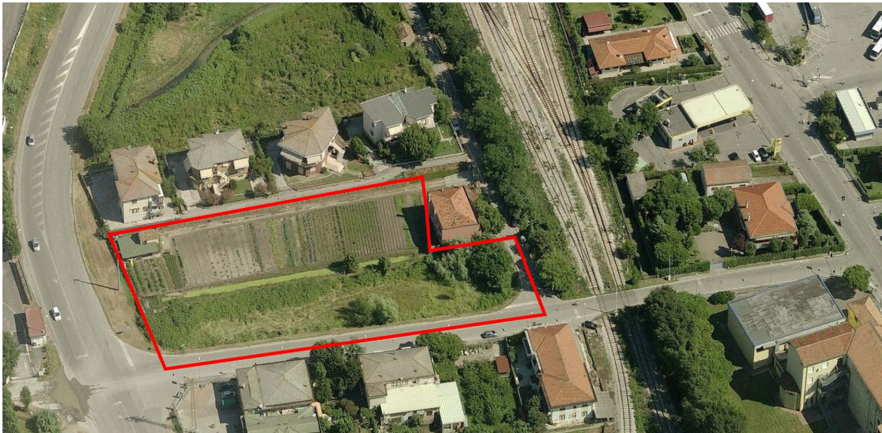
1. Vista aerea da Sud