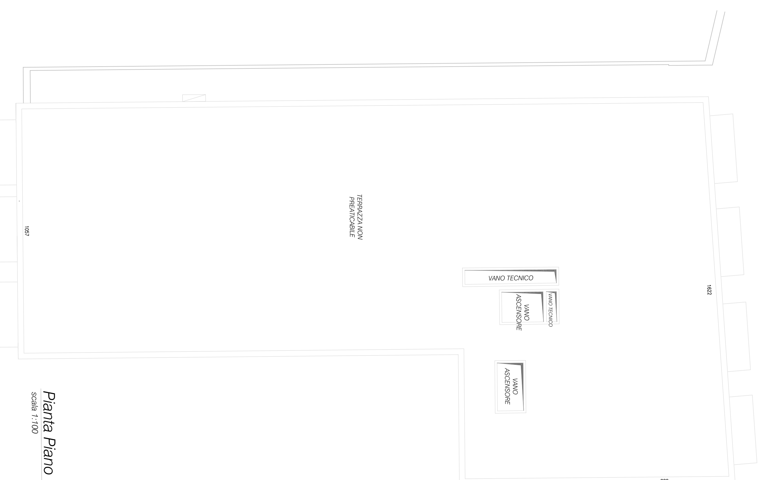
Pianta Piano Quinto Scala 1:100