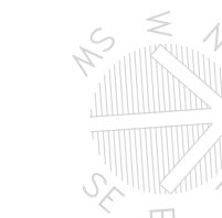
Dimostrazione grafica calcolo superficie lorda scala 1:200