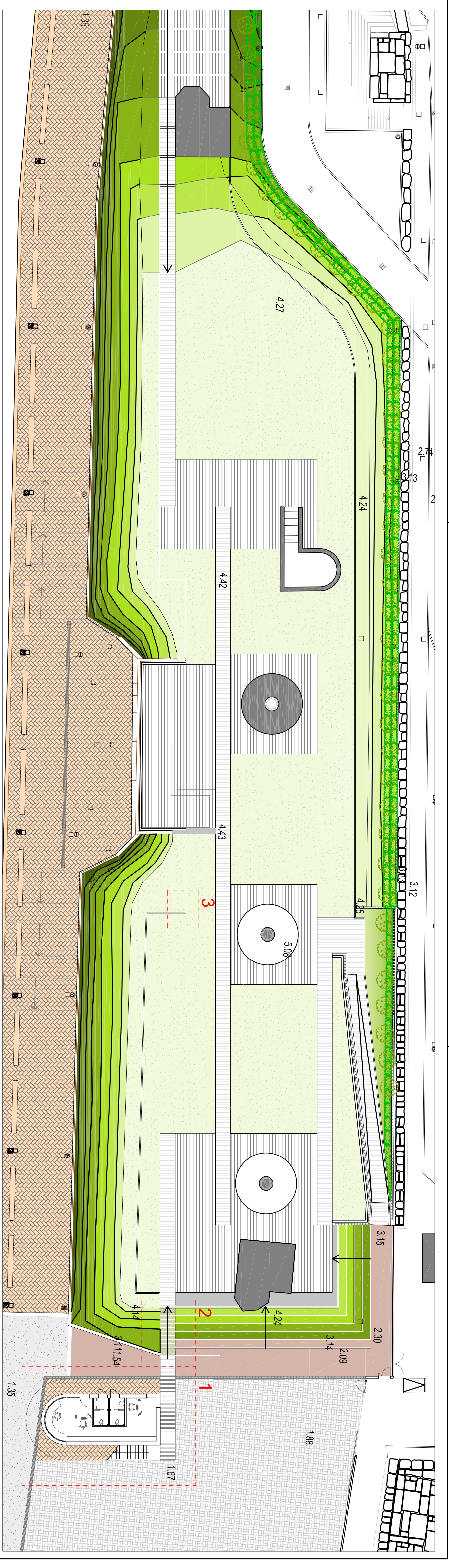
1. Progetto - Estratto planimetria