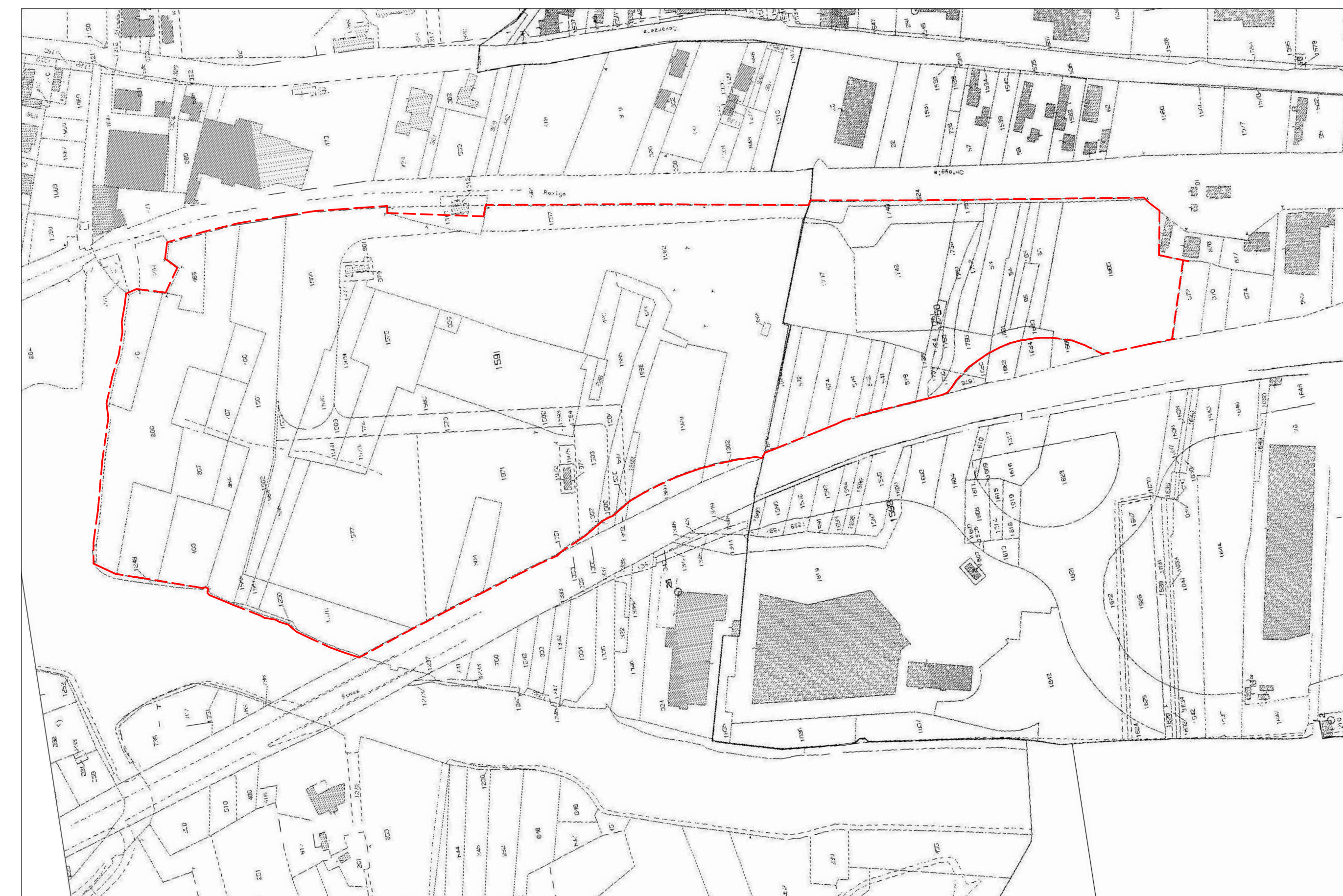
ESTRATTO DI MAPPA Fg 38-41 scala 1 : 2000