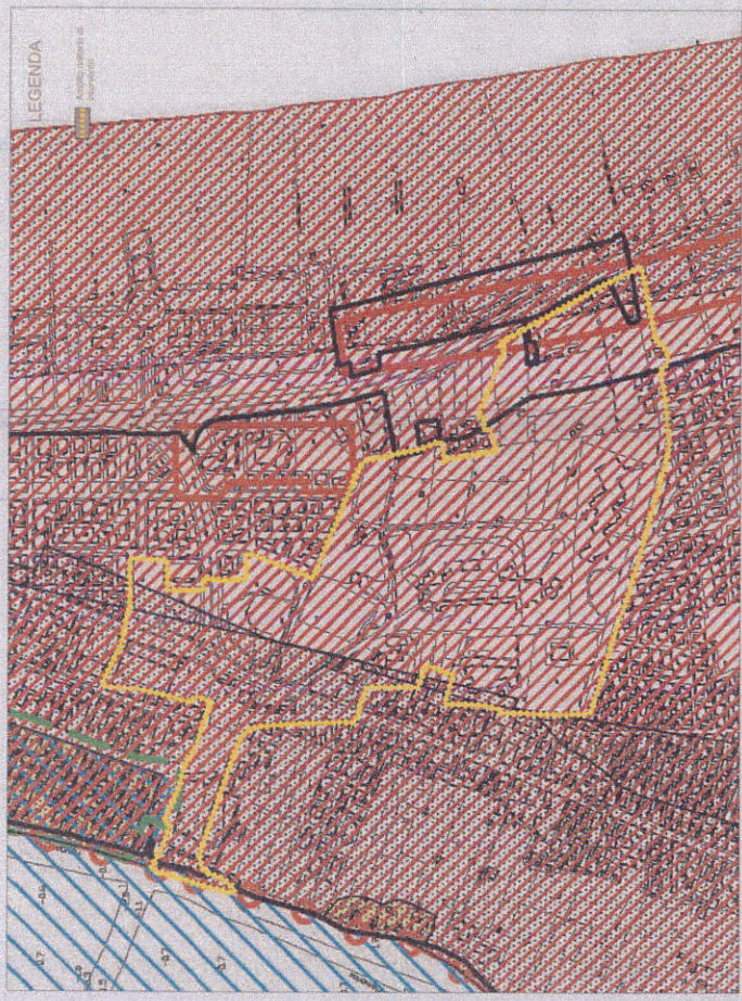
TAVOLA DEI VINCOLI - RIPRESA AEREA - scala 1:3000