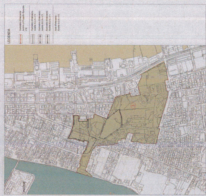
CTR - scala 1:5000

STUDIO CONSULTING ARCHITETTURA E URBANISMO VIA S. GIUSEPPE 10 30138 VENEZIA (VE) TEL. 041 5200000 WWW.STUDIOCONSULTING.IT