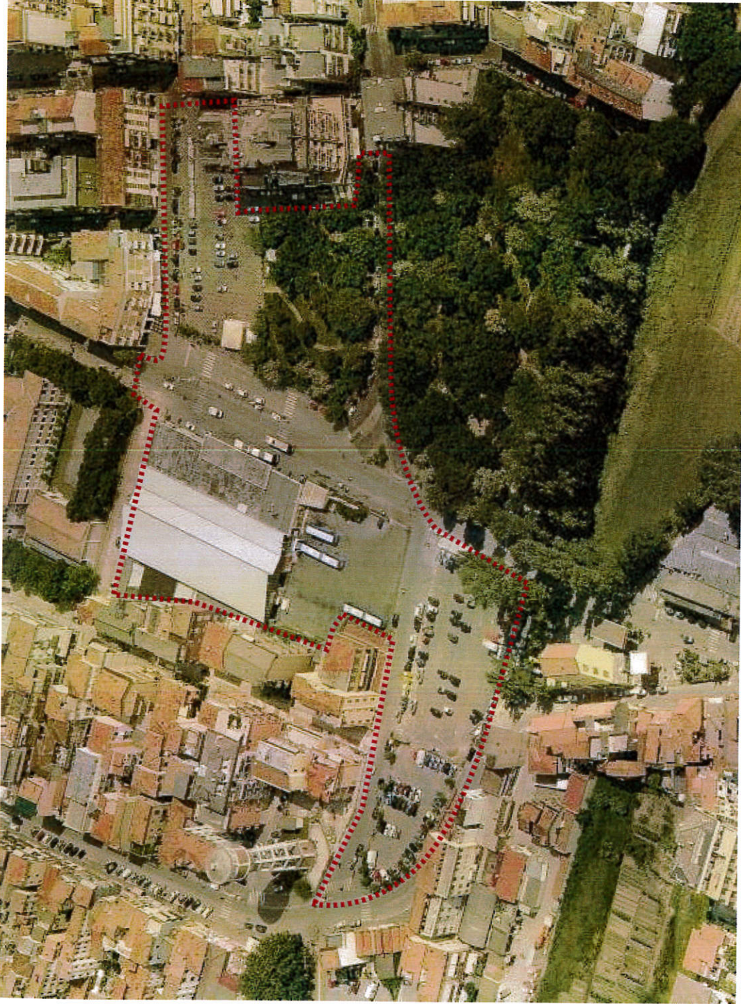
Vista aerea da Sud