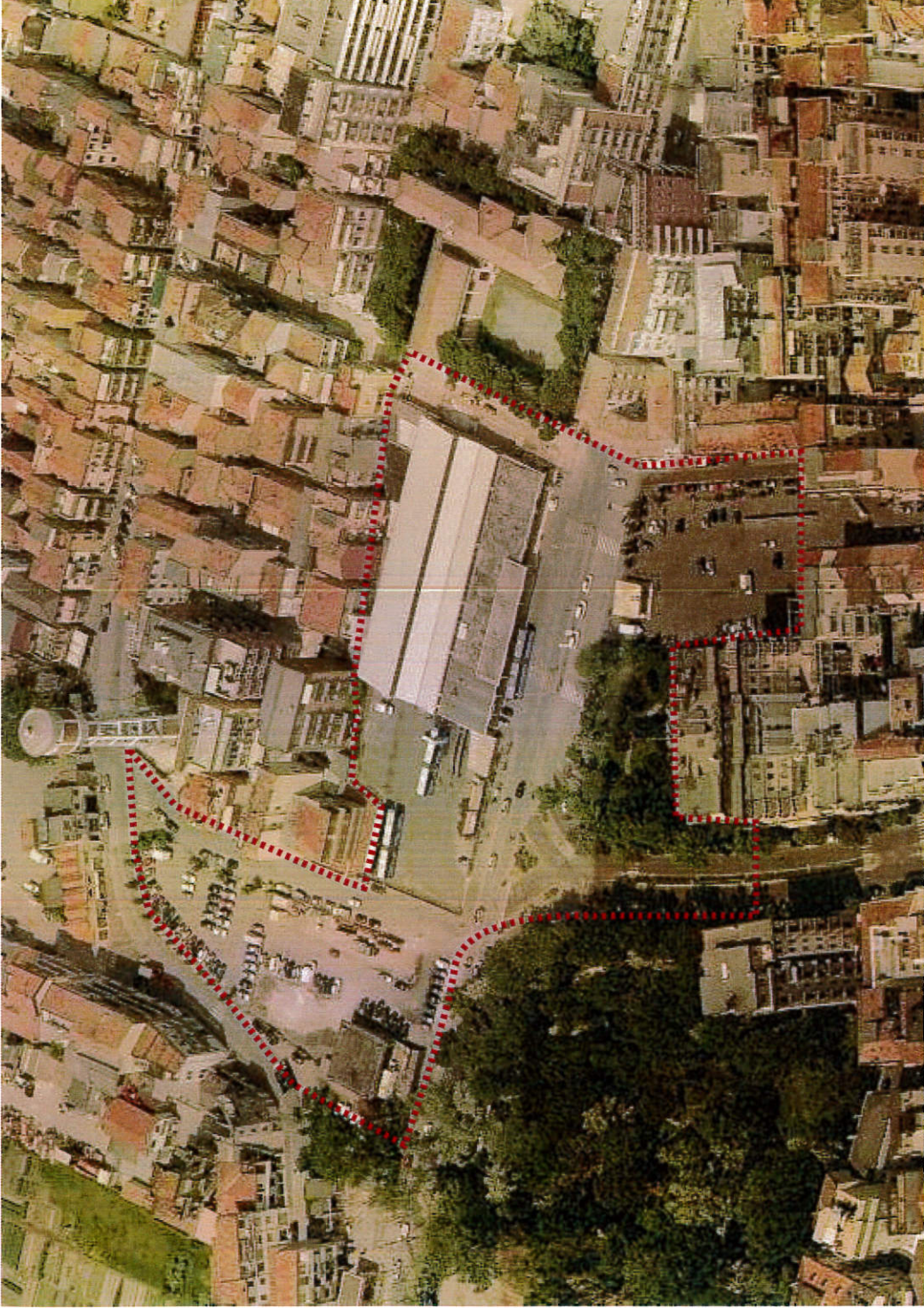
Vista aerea da Est