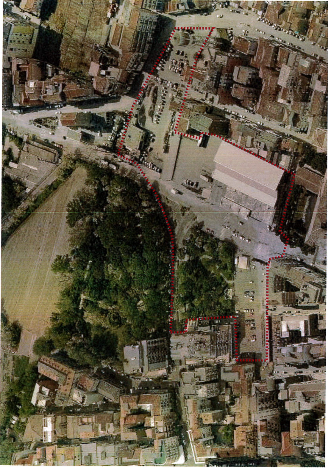
Vista aerea da Nord