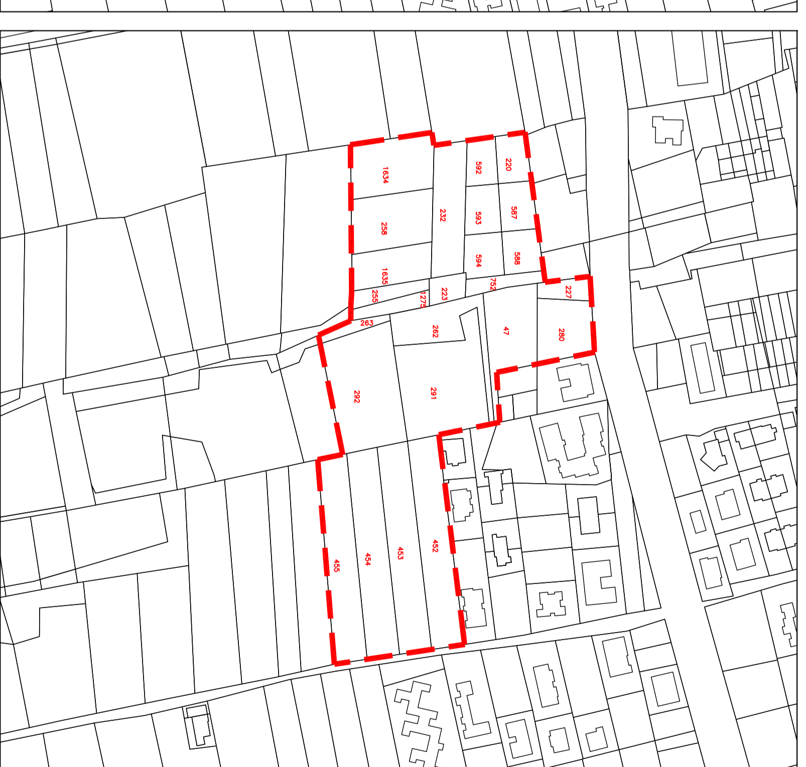
ESTRATTO DELLA PLANIMETRIA CATASTALE NUOVA PERIMETRAZIONE COMPARTO C2/3 (escluso del mappale 215) SCALA 1:2000