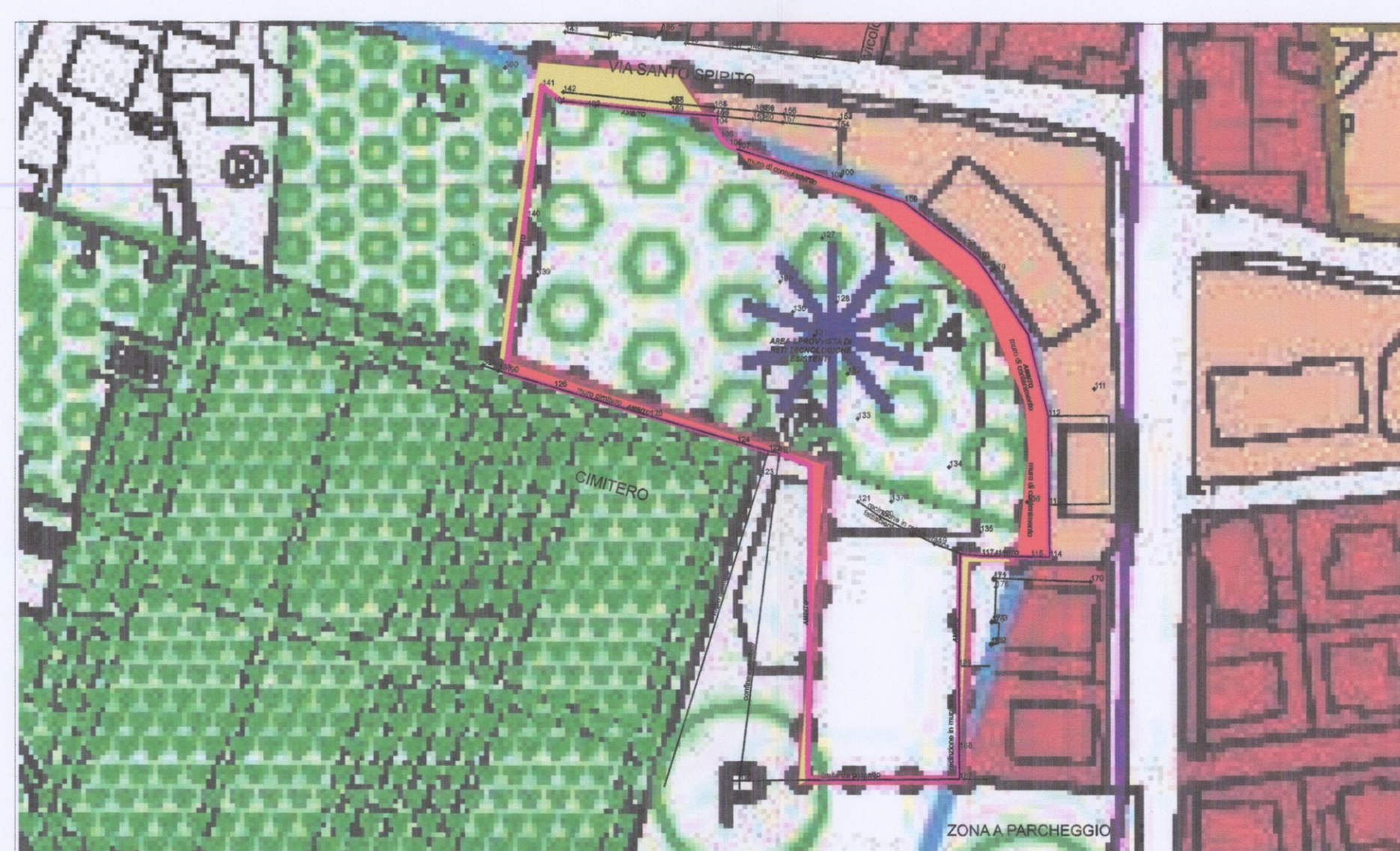
RIPERIMETRAZIONE / COMPARAZIONE 1:1000