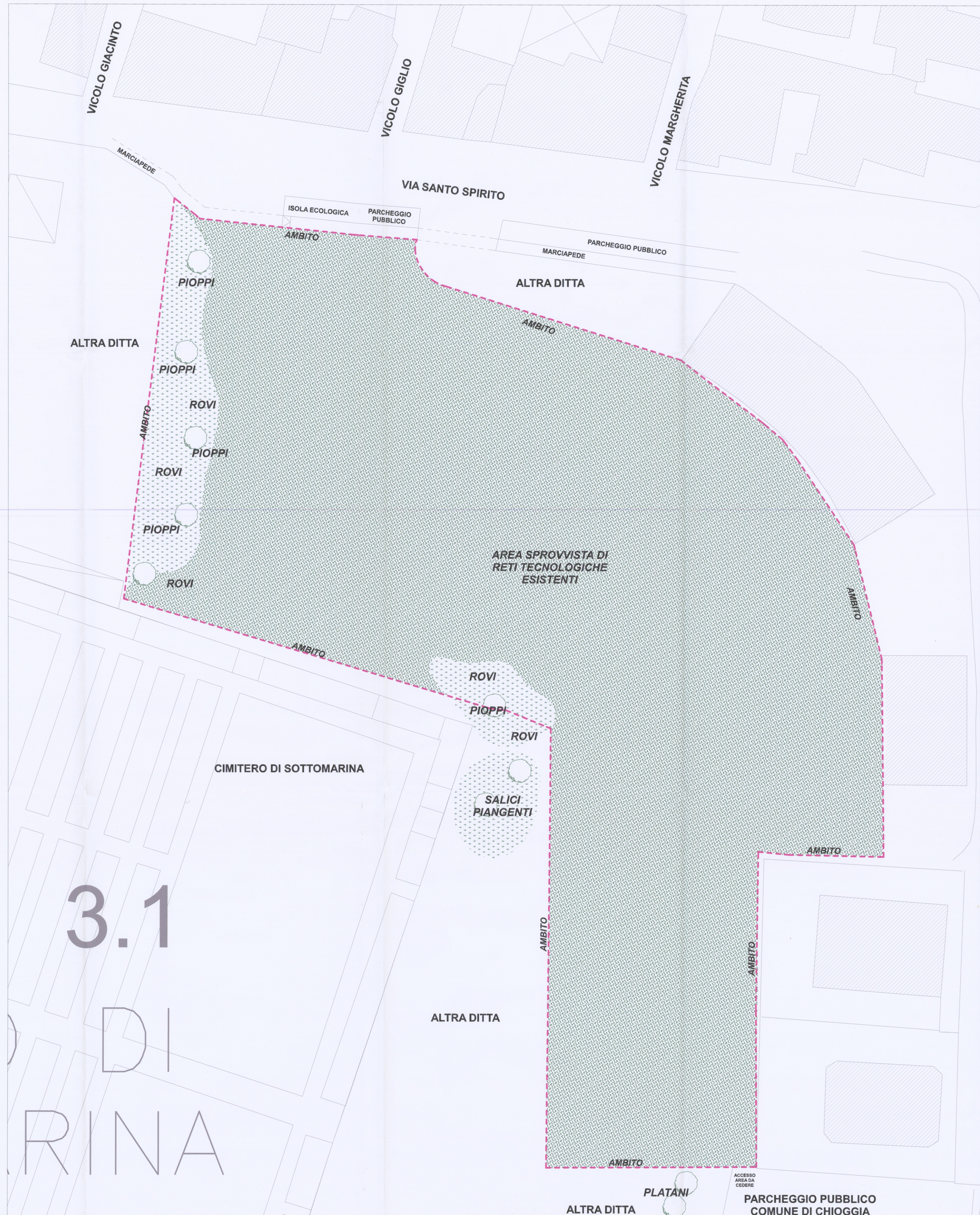
STATO DI FATTO 1:200